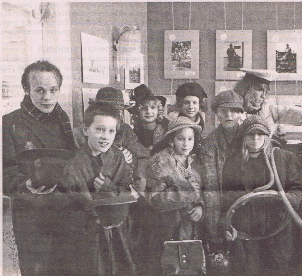
«Шкиды»: «Подайте предводителю дворянства!»

У каждого в душе свой Остап Бендер. Кому из нас хоть раз в жизни не хотелось быть таким же легким, остроумным, удачливым, авантурным и при этом чтобы все шло с рук? Поэтому посещение музея Остапа Бендера как минимум приподнимает настроение.