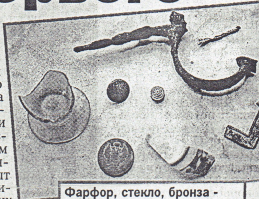
Фарфор, стекло, бронза - все это было по карману только самодержцу.

На сегодняшний день уже полностью восстановлена картина того, как все это величие выглядело почти три столетия назад. Песчаный мыс, на котором располагался деревянный дворец, был размыт водами Финского залива. А дожившие до наших дней вековые деревья не что иное, как один из участков Голландского сада. На территории сада прослежены утраченные дорожки, траншеи для посадок, заполненные плодородной землей, возвышенные