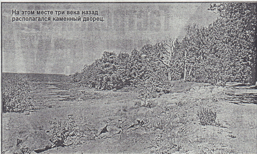
На этом месте три века назад располагался каменный дворец.

На берегу Финского залива точно установили место, где в Голландском саду любил отдохнуть император