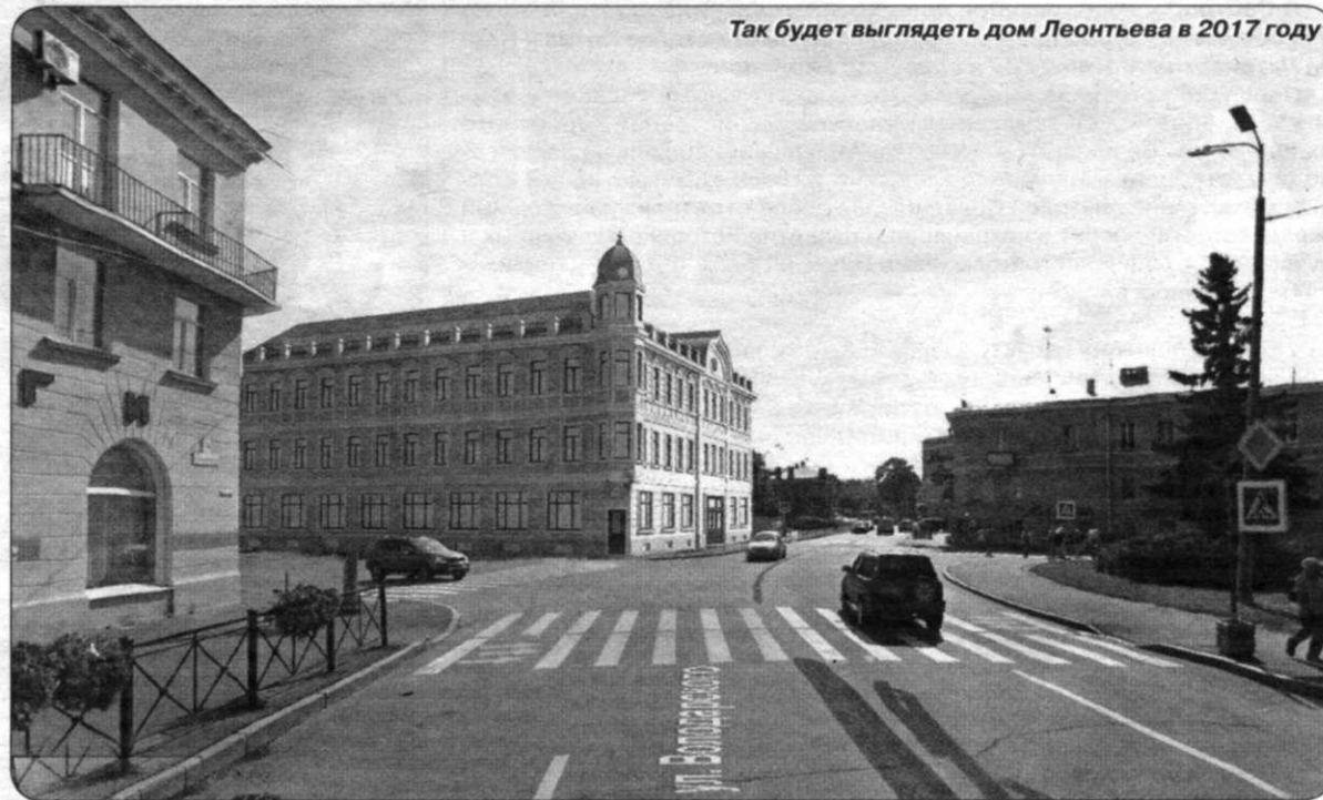
Так будет выглядеть дом Леонтьева в 2017 году