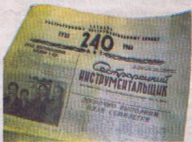
Номер к 240-летию завода. 1961 г.

«Сестрорецкий инструментальщик» с 1966 по 1992 год