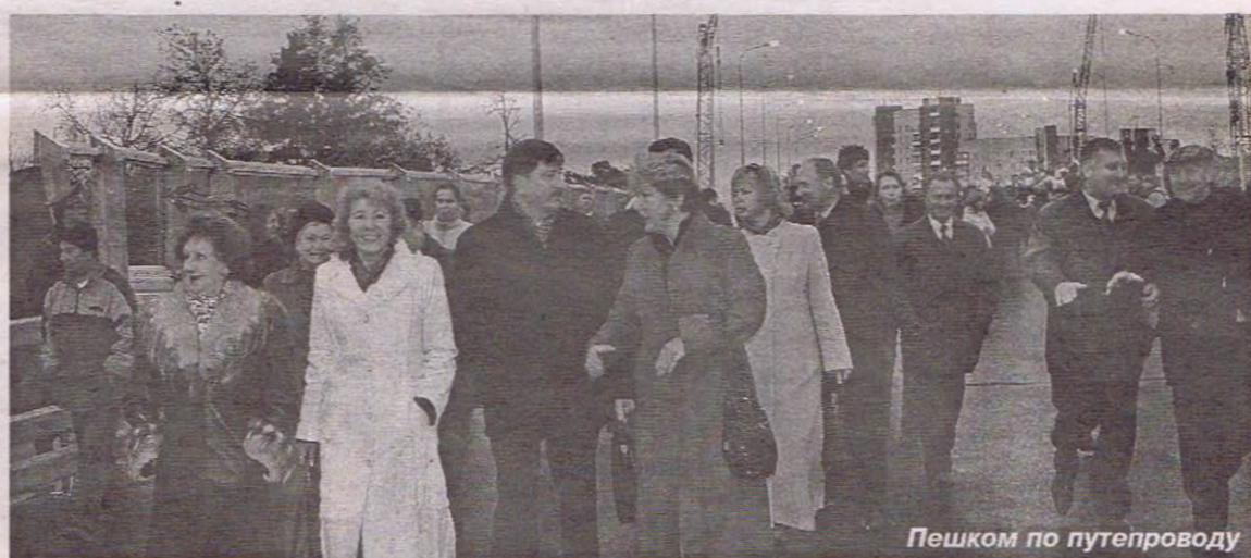
Пешком по путепроводу

реца главным приоритетом сделали безопасность пешеходов: на улицах города было установлено 4 дополнительных светофора, появились ограничительные дорожные знаки и разметка, 3 круглосуточных поста ДПС. Грузовому транспорту сквозной проезд через Сестрорецк запретили.