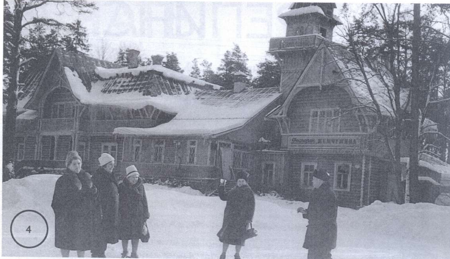
Бывшая вилла Лепони. После 1918 г. — Терийокский Морской Курорт. В советское время — ресторан «Жемчужина».