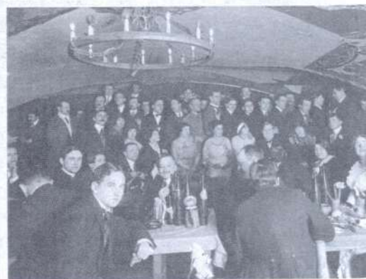
Публика в «Бродячей собаке» в 1912–1913 гг.