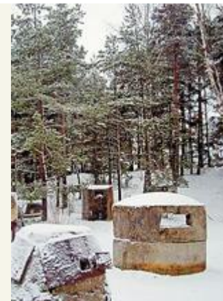
Остатки огневых точек, собранные по окрестным лесам

Доты обычно располагались на расстоянии одного-двух километров друг от друга, промежутки между ними были труднодоступны или заболочены. Если «Слон» держал под огнем болото до Белоострова, то дорогу на Выборг