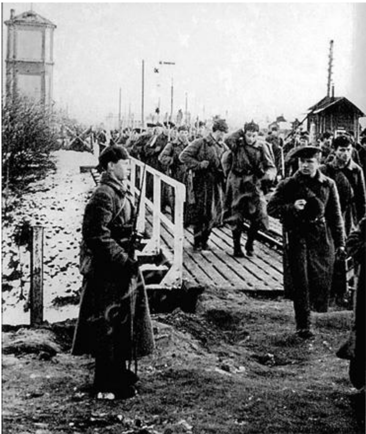
Солдаты Красной армии переходят реку Сестру в декабре 1939 года