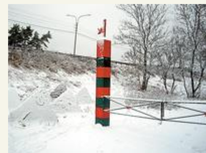
На старую Белоостровскую дорогу, ведущую к музею, лучше выходить у ресторана «Тайм-аут»