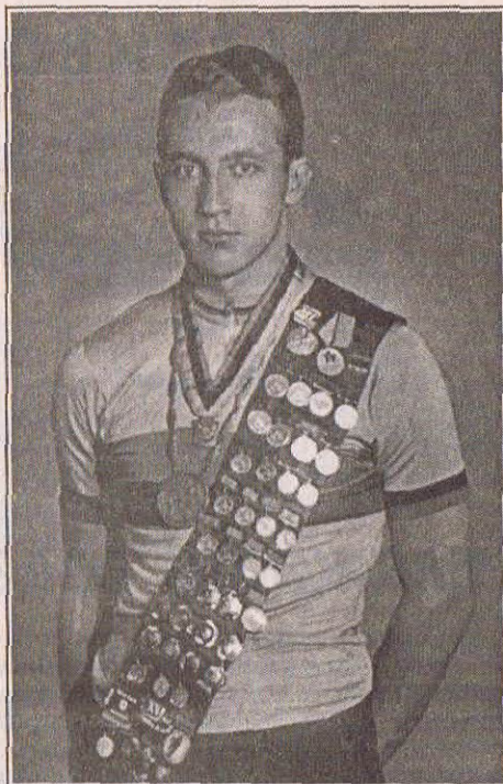
Станислав Москвин (1962 год)