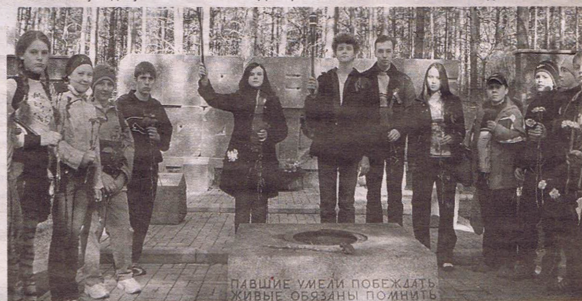
ПАВШИЕ УМЕЛИ ПОБЕЖДАТЬ ЖИВЫЕ ОБЯЗАНЫ ПОМНИТЬ

райте материалы о бывших учениках вашей школы – участниках Великой Отечественной войны. Помните, ребята, они были вашими ровесниками, они уходили на фронт со школьной скамьи. Пусть не останется ни одного забытого имени тех, кто погиб в боях за нашу Родину.