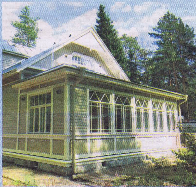
Вилла Рено после реставрации

В 2018 году общестроительные работы по воссозданию виллы Рено завершились. Старую обшивку вернули на новые стены. Здание-новодел, как и прежде, — деревянное на гранитном фундаменте. Внутри восстановлены печи.