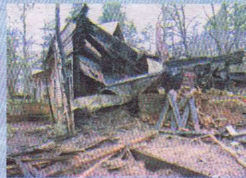
Вилла Рено после пожара