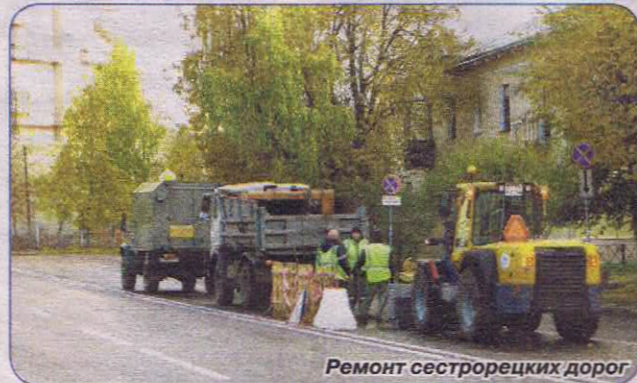
Ремонт сестрорецких дорог

В городском конкурсе по благоустройству в номинации «Лучший объект благоустройства, созданный руками жителей» второе место занял цветник на ул. Инструментальщиков, д.25.