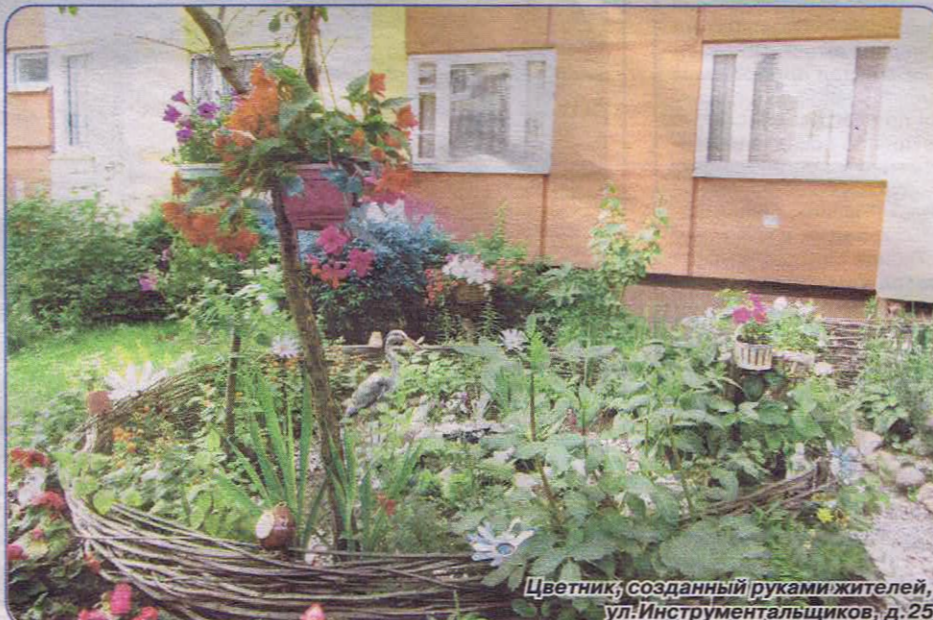
Цветник, созданный руками жителей, ул. Инструментальщиков, д.25

Были установлены новые детские и спортивные площадки, а также уличные спортивные тренажеры. Опыт работы в предыдущие годы показал, что наилучшим образом себя зарекомендовали площадки с искусственным покрытием, теперь они есть во многих дворах города Сестрорецка. В 2013 году новым спортивным оборудова-