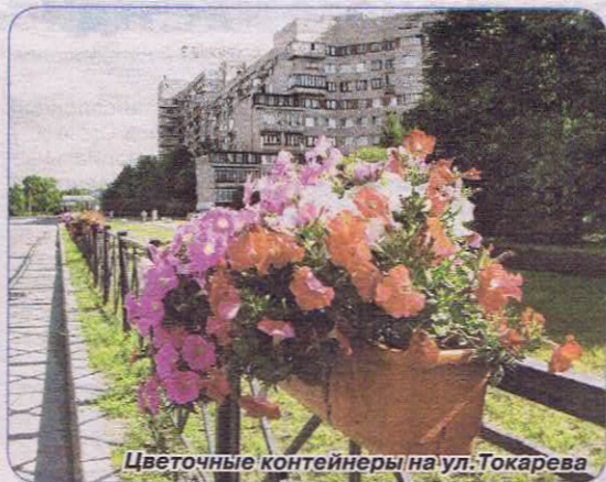
Цветочные контейнеры на ул. Токарева