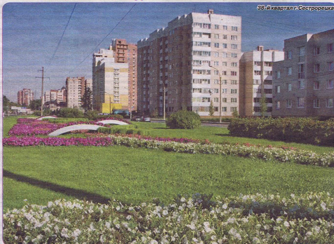
38-й квартал г.Сестрорецка

Улицы Сестрорецка украшались к праздничным мероприятиям , посвященным Новому году, Дню Победы, Дню основания Сестрорецка и другим – световые гирлянды и баннеры, флаги и декоративное освещение фасадов – всё это помогает поднять настроение жителей в праздничные дни. В 2013 году к Рождеству традиционным подарком для православных верующих стали ледяные фигуры ангелов, которые были установлены у входа в храмы Петра и Павла подводного флота России, храма Рождества Пресвятой Богородицы в поселке Александровская и храма святого целителя Пантелеймона в поселке Тарховка.