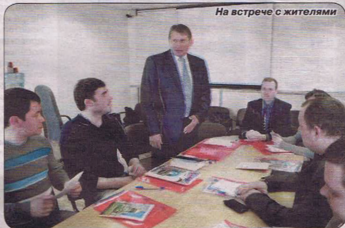
На встрече с жителями

Всего же представители Муниципального совета приняли участие в более чем 650 мероприятиях различного уровня , в том числе, муниципального, районного, городского, федерального и международного.