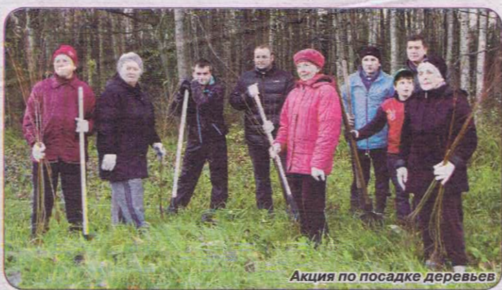
Акция по посадке деревьев

С 1 апреля 2012 года вывоз мусора с территории частного жилищного сектора не входит в компетенцию органов местного самоуправления. Жители должны самостоятельно заключать договоры на вывоз мусора с обслуживающими организациями. Тем не менее, органы местного самоуправления не оставили в стороне этот важный вопрос и оказывали организационное и информационное содействие жителям в его решении.