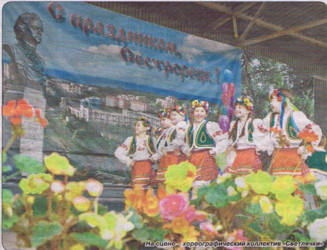
На сцене – хореографический коллектив «Светлячки»

Депутаты Муниципального совета особую заботу проявляют к ветеранам. Они занимают активную жизненную позицию, принимают участие в городских мероприятиях, а также сами инициируют проведение праздников, создание новых памятных мест, участвуют в спортивных соревнованиях, в работе хо-