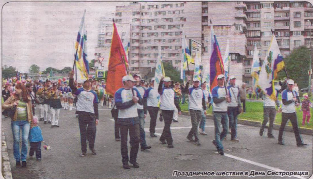
Праздничное шествие в День Сестрорецка