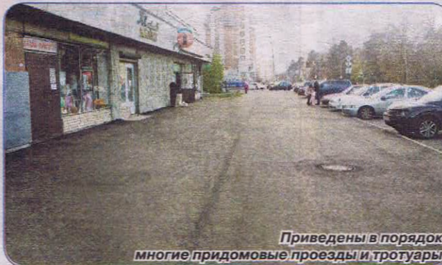
Приведены в порядок многие придомовые проезды и тротуары