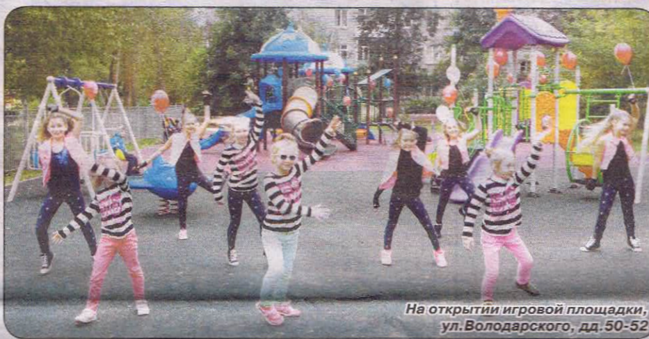
На открытии игровой площадки, ул. Володарского, дд.50-52