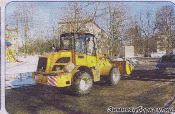
Зимняя уборка улиц