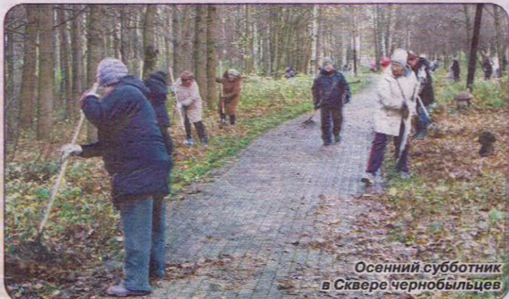
Осенний субботник в Сквере чернобыльцев

Органы местного самоуправления в рамках своих полномочий уделяли внимание экологическим проблемам озера Сестрорецкой Разлив, которое активно заболачивается и требует очистки. Муниципальный совет вмешался в ситуацию, связанную с проведением дноуглубительных работ на участке акватории озера в районе лодочного кооператива, направив соответствующие обращения в надзорные органы. В течение года депутаты Муниципального совета уделяли постоянное внимание и другим экологическим проблемам.