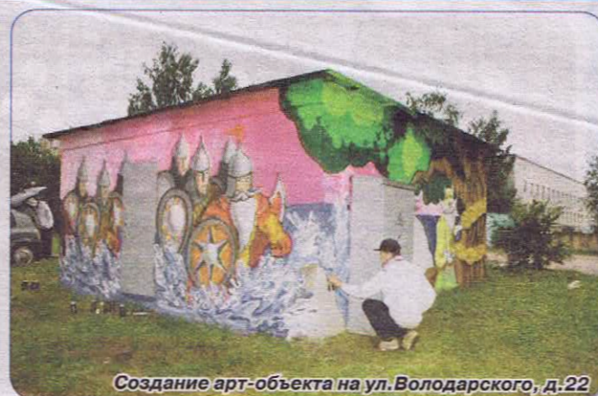
Создание арт-объекта на ул. Володарского, д.22

Одним из наиболее приоритетных направлений работы органов местного самоуправления муниципального образования города Сестрорецка является реализация целевых адресных программ, направленных на решение вопросов местного значения. В конце каждого календарного года они составляются Местной администрацией по предложениям жителей муниципального образования и депутатов Муниципального совета. Наиболее существенное значение среди них имеют программы по благоустройству и охране окружающей среды. В 2013 году по данному направлению было реализовано сразу 10 муниципальных программ.