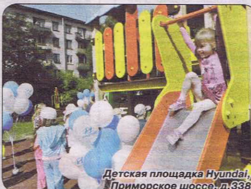
Детская площадка Hyundai, Приморское шоссе, д.338