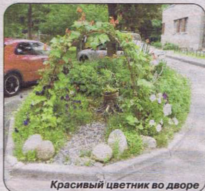
Красивый цветник во дворе

Проведен ремонт ранее установленных газонных ограждений, повреждённых в зимний период – 1630 погонных метров. По просьбам жителей дополнительно установлено около 1368 погонных метров новых ограждений, в том числе, по адресам: Приморское шоссе, дд.261а, 263, 265, 269, 271, 273, 275, 277, 281 корп.2, 330; ул. Мосина, д.1; ул. Токарева, д.12, 13-а, ул. Пляжная, ул. Володарского, д.36.