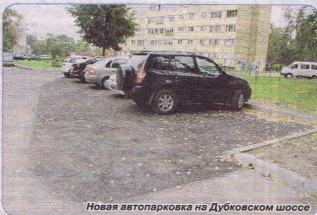
Новая автопарковка на Дубковском шоссе