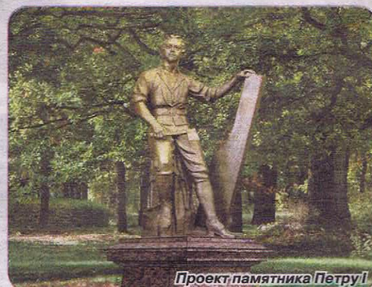
Проект памятника Петру I

К 300-летию города хорошим подарком сестроречанам станет памятник Петру I – плотнику, установка которого будет осуществлена летом 2014 года в парке культуры и отдыха «Дубки».