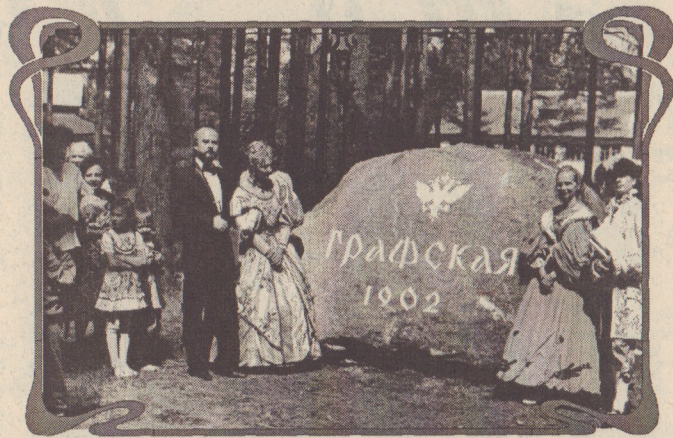
"История поселков Графская-Дыбунь-Песочная"; "Религиозно-просветительская жизнь в поселке. Встрече

ботана программа краеведческих чтений на весь 2002 год под названием "Я люблю эту землю". В нее вошли следующие темы: