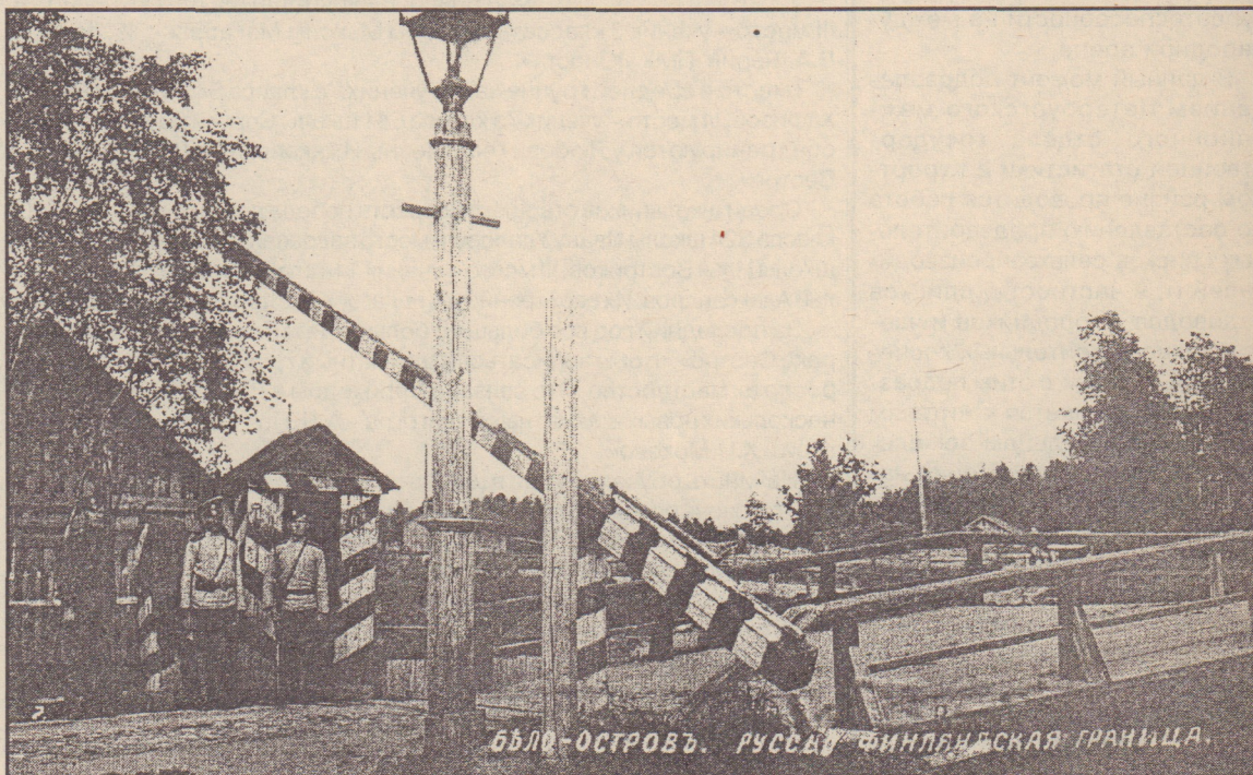
БЕЛО-ОСТРОВЪ. РУССКО-ФИНЛЯНДСКАЯ ГРАНИЦА.