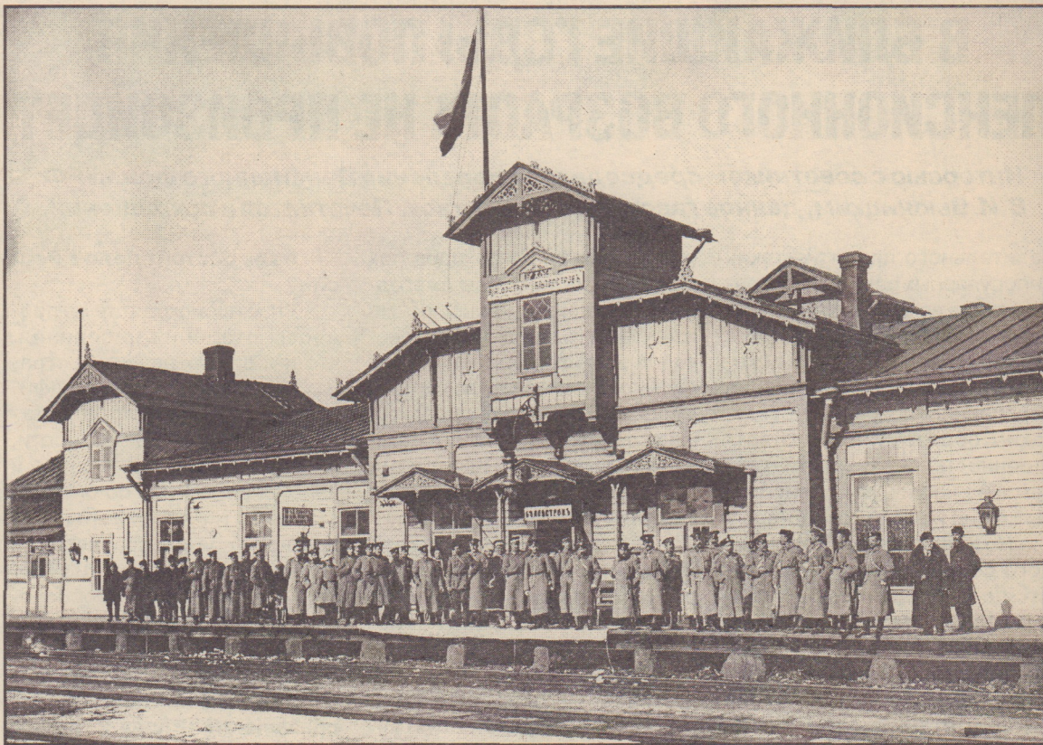
Пограничная стража и группа офицеров гвардейской пехоты ждет прибытия поезда на станции Белоостров. 1908 год

2. Смешение пассажиров всех трех классов в одном помещении представляется в высшей степени неудобным и