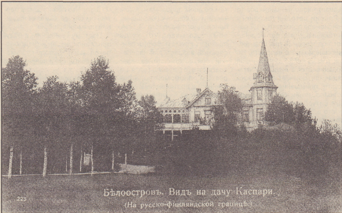
Белоостров. Видъ на дачу Каспари. (На русско-Финляндской границѣ)

вызывает нарекания со стороны интеллигентной публики.