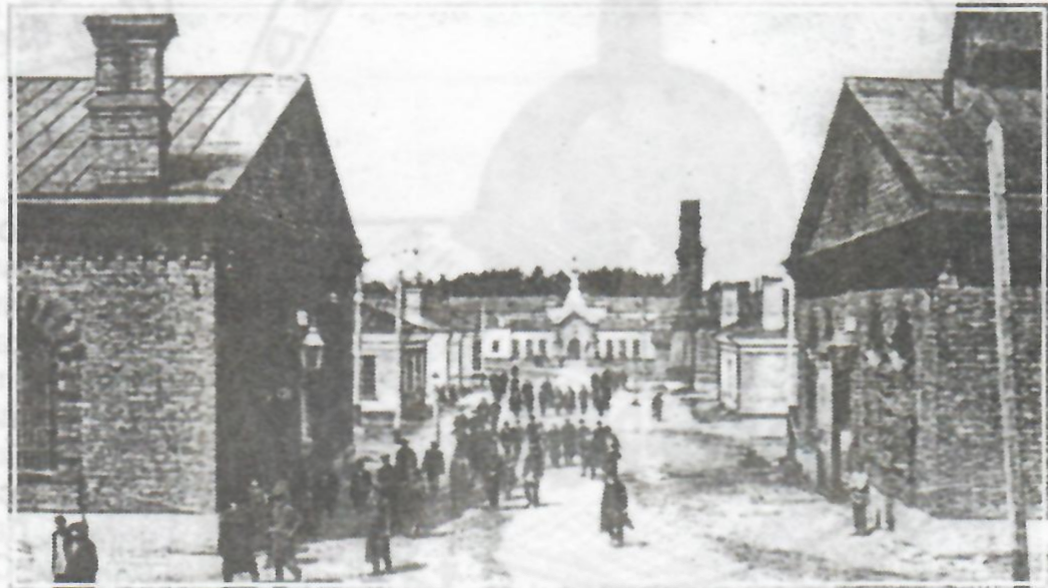
Вид завода (середина 19 века)