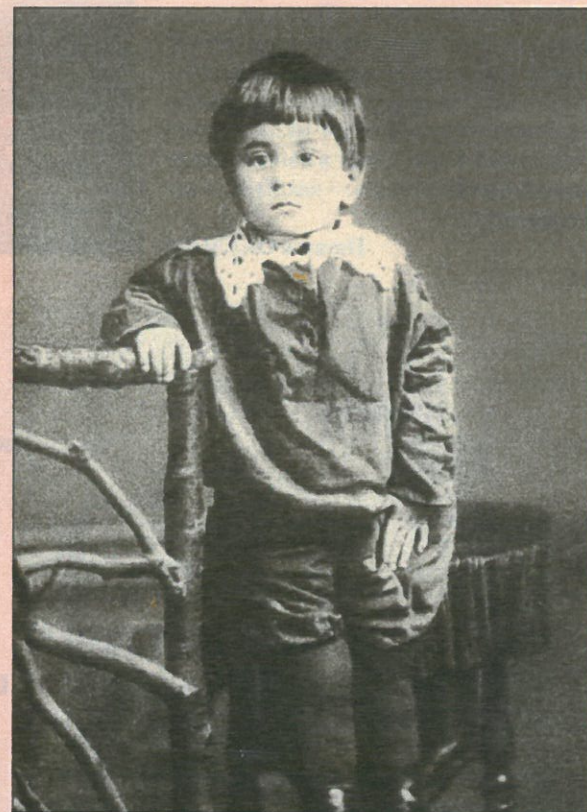
Мише Зощенко два года. 1897 г.

Когда Зощенко стали много печатать, гонорары полились рекой, и со временем жена значительно изменила меблировку: спальный гарнитур в стиле Людовика XVI, картины в золоченых рамах, фарфоровые пастушки и пастушки, в углу — раскидистая пальма. Сам Зощенко по рассеянности, кажется, и не замечал всех этих изменений. Но