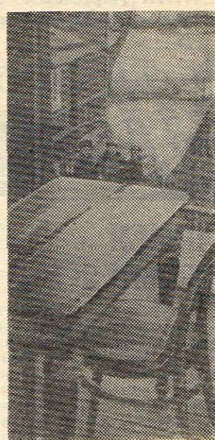
Рабочее место В. И. Ленина в «Сарае». Разлив.

Связь Ильича с Петроградом была бесперебойной, но добираться до нас не всегда было просто.