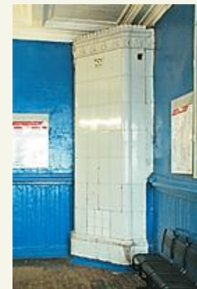
Старая кафельная печь сохранилась, но уже не топится