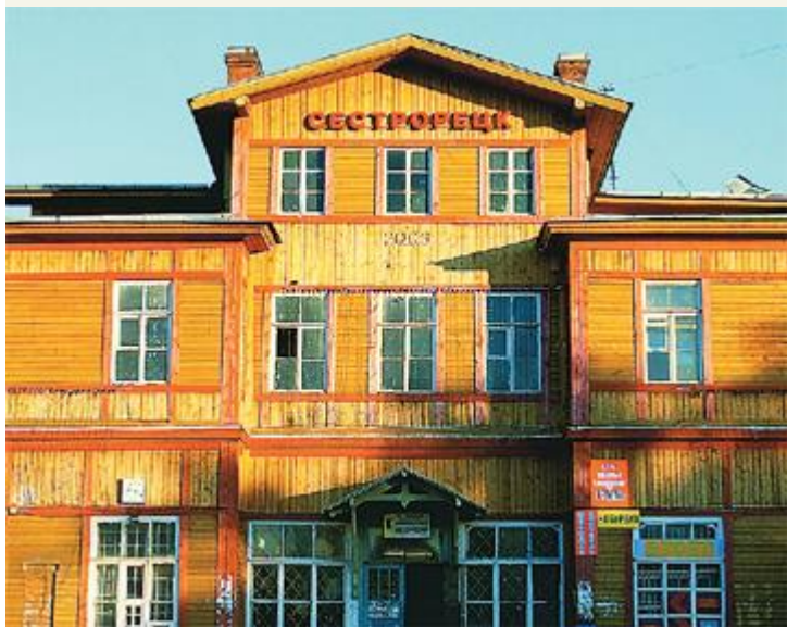
Железнодорожные станции — обычно первый объект обстрелов и разрушений. Сестрорецкий вокзал удивительным образом выстоял в Гражданскую, и в финскую, и в Отечественную

направлению к нынешнему Солнечному, а поворачивали к Белоострову. Так образовалась круговая Финляндская дорога.