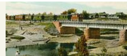
Мост через Водосливный канал

Через шесть лет после открытия дороги Сестрорецк перестал быть конечной станцией, дорогу продлили к новым дачам и пансионатам — в Курорт и Дюны, до старой финской границы. А с Белоостровом, с выборгской веткой, независимую Приморскую соединили лишь в 1924 году, после того как сильнейшее наводнение (см. фотографии в прошлом номере) снесло мост в Лахте между заливом и Разливом. Нужно было снабжать сестрорецкий завод, на границе с независимой Финляндией развертывалось строительство укрепрайона, поэтому рельсы с участка Курорт — Дюны сняли и переложили на новый участок. Теперь поезда после Курорта уже не шли вдоль берега по