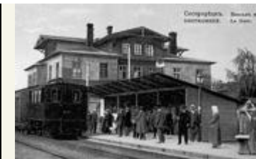
До электрификации ветки платформы были низкие, почти вровень с рельсами

направлению к нынешнему Солнечному, а поворачивали к Белоострову. Так образовалась круговая Финляндская дорога.