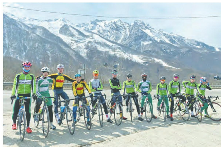
Команда школы-интерната на тренировке

Профильным видом спорта школы-интерната был всегда ве-