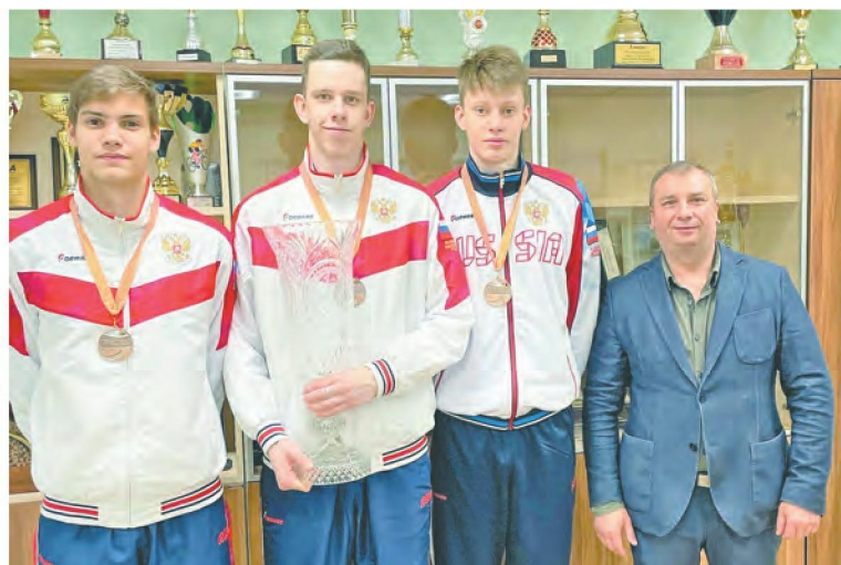
Подрастает новая смена чемпионов