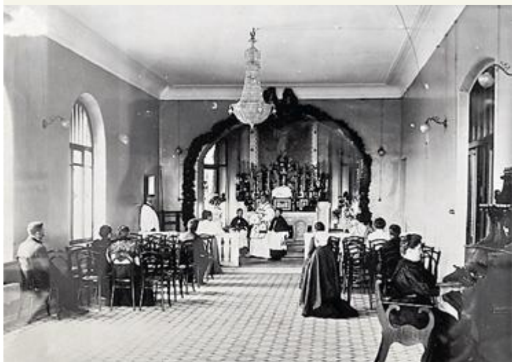
Приют назывался международным, потому что пожертвования на его строительство собирались во многих странах

Старый Сестрорецк, что располагался между заводом и Разливом, снесли в 1960-е годы, когда по берегу озера поперек старой сетки улиц пустили автомагистраль — будущую «Скандинавию», а с другой стороны «на пустом месте» выстроили многоэтажные дома. То же самое произошло и с предместьями Ленинграда — ничего не осталось от старого Лесного, Гражданки, Автова.