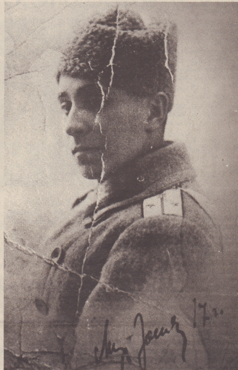
М. Зощенко во время службы в армии. Редкая фотография

Но это произошло позднее. Рассказами Зощенко зачитывалась вся страна. Он много работал для театров. Две комедии были поставлены в Ленинградском драматическом театре, а одна из них – «Парусиновый портфель» – выдержала 200 представлений за год. Во время эвакуации в Алматы он был зачислен сотрудником