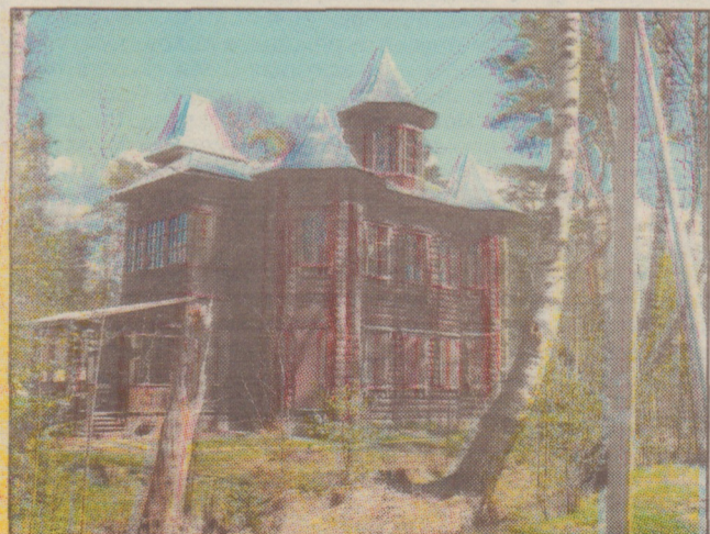
Песочный, ул. Октябрьская, дом 20 (современное фото)