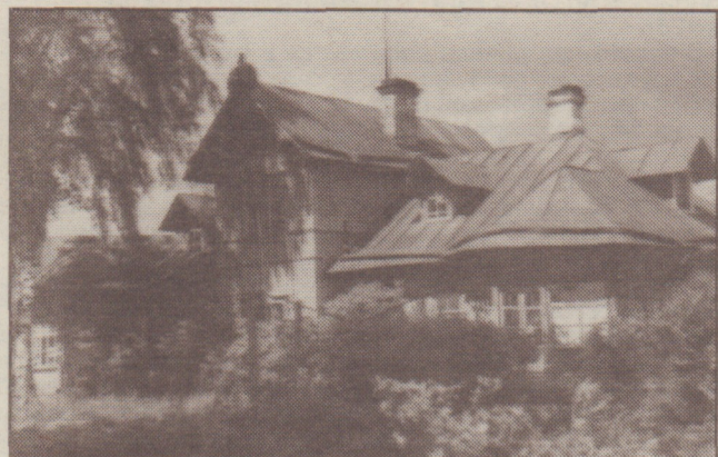
Дибуны, ул. Новгородская, дом 62 (фото середины XX века)