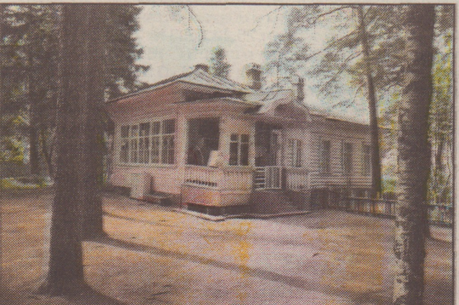
Песочный, ул. Садовая, дом 15 (современное фото)