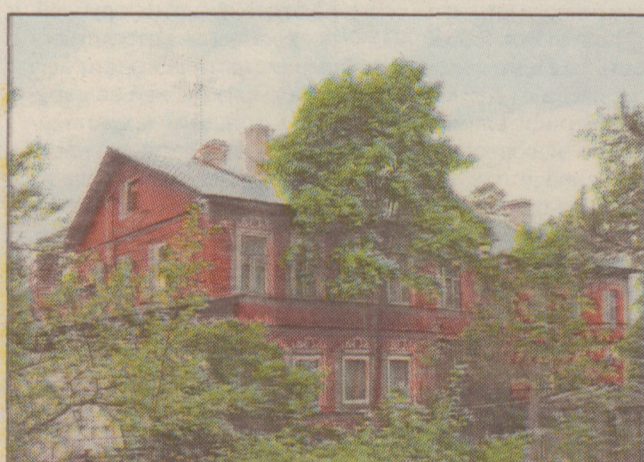
Песочный, ул. Ленинградская, дом 3 – дача семьи Орнатских (современное фото)