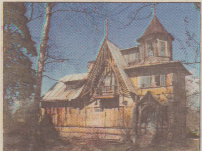
Песочный, ул. Железнодорожная, дом 14 (современное фото)