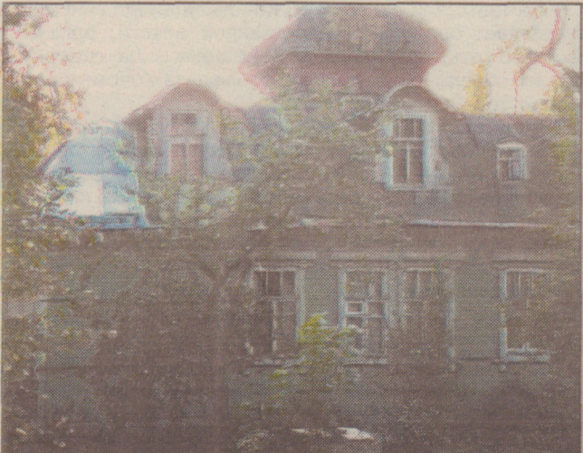
Песочный, ул. Речная, дом 25 (фото конца XX века)