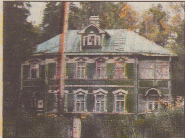
Песочный, ул. Дачная, дом 34 (фото конца XX века)

Памятники истории и культуры местного значения. Дачи модерн в пос. Песочный Администрация Санкт-Петербурга КОМИТЕТ ПО ГОСУДАРСТВЕННОМУ КОНТРОЛЮ, ИСПОЛЬЗОВАНИЮ И ОХРАНЕ ПАМЯТНИКОВ ИСТОРИИ И КУЛЬТУРЫ ПРИКАЗ № 15 от 20 февраля 2001 года Об утверждении Списка вновь выявленных объектов, представляющих историческую, научную, художественную или иную культурную ценность (с изменениями на 14 июня 2006 года)