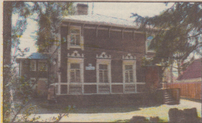
Дибуны, ул. Карла Маркса, дом 61 (современное фото)