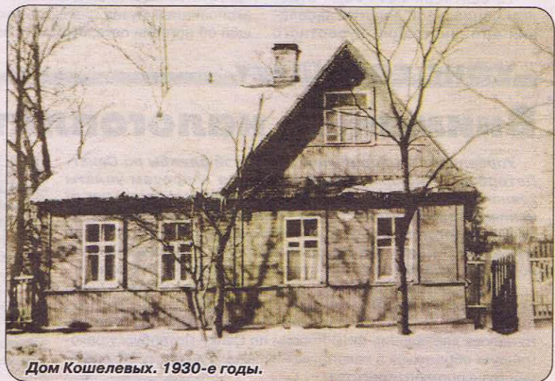
Дом Кошелевых. 1930-е годы.