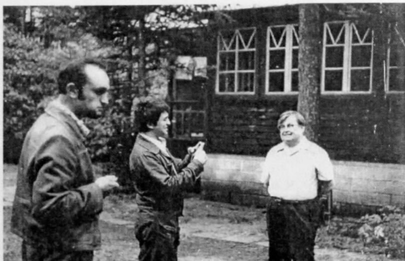
В Комарово с молодыми музыкантами

на вопрос: «Долго ли Вы работаете над песней?» ответил: «Одну из последних — «Письмо из экспедиции» — сочинял около года». Теряя в легкости, в продуктивности, он выигрывал в значительности, стремился расширить образный мир песни, искал и находил пути развития песенного жанра и своего личного творчества, новые темы, формы.