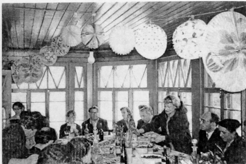
Праздник на комаровской веранде