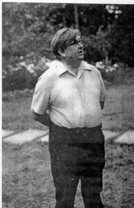
В шестидесятые годы