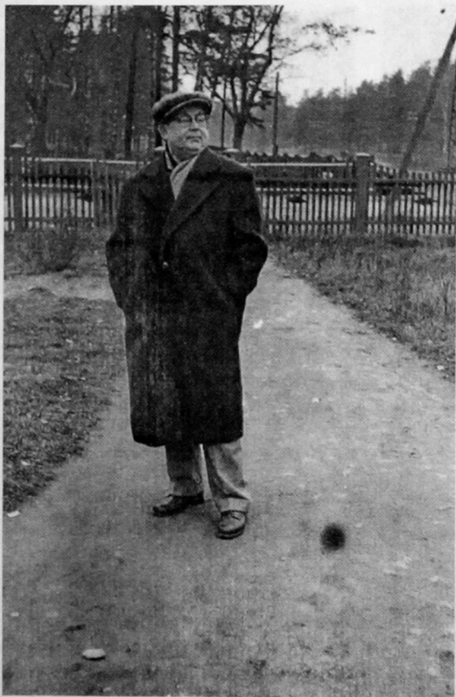
Мужчина в пальто и шапке стоит на тропинке в саду.