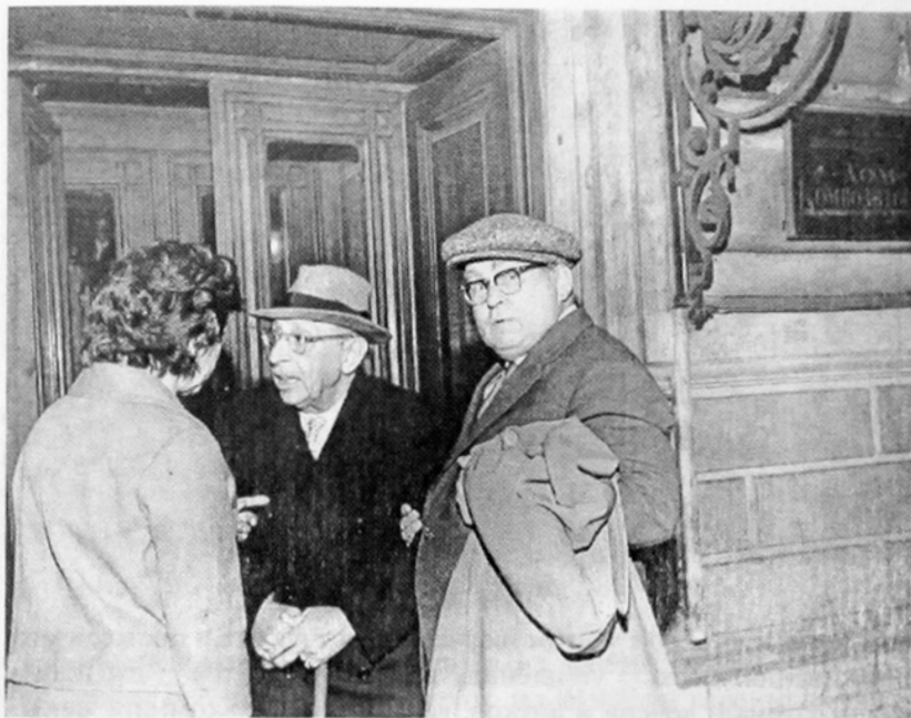
С Игорем Стравинским

Бытовые, жилищные условия были в Ленинграде нелегкими. Для того, чтобы облегчить композиторам творческую работу, Соловьев-Седой добился расширения Дома творчества композиторов в Репино, предоставления квартир, ссуд. Выкроить время для собственной работы становилось все трудней: то, что композитора в Ленинграде, можно сказать, все знали, многие с ним учились, дружили, открывало двери его квартиры на Фонтанке, в доме 131. Как руководитель, он был занят всю вторую половину дня и уставал много больше, чем от сочинения музыки.