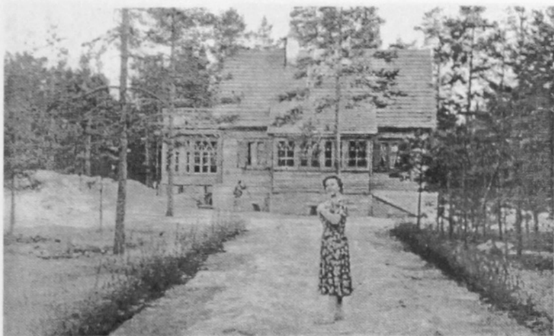
Дом в Комарово

оригинальность, но с учетом творческого комфорта и постоянного проживания: слева — утепленная веранда, в центре — столовая, рядом комната дочери и внуков, верхний этаж — комната жены. Скромнее всего был его кабинет, шагов семь-восемь в длину и