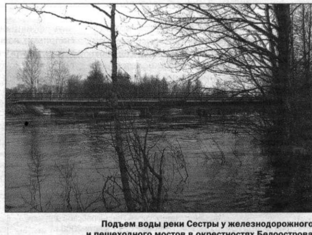
Подъем воды реки Сестры у железнодорожного и пешеходного мостов в окрестностях Белоострова