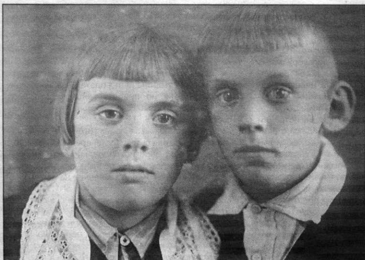
С братом Георгием