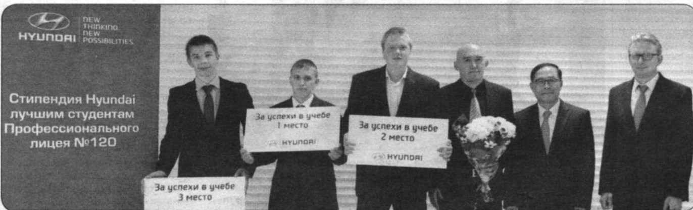
Стипендия Hyundai лучшим студентам Профессионального лицея №120