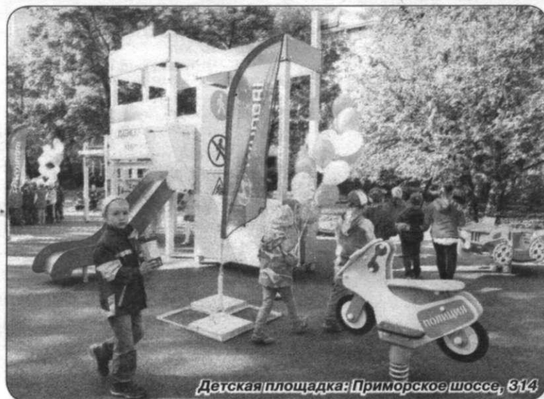
Детская площадка: Приморское шоссе, 314

декабрь 2011 года: завод получил премию лучшего иностранного предприятия Hyundai Motor Company по показателям каче-