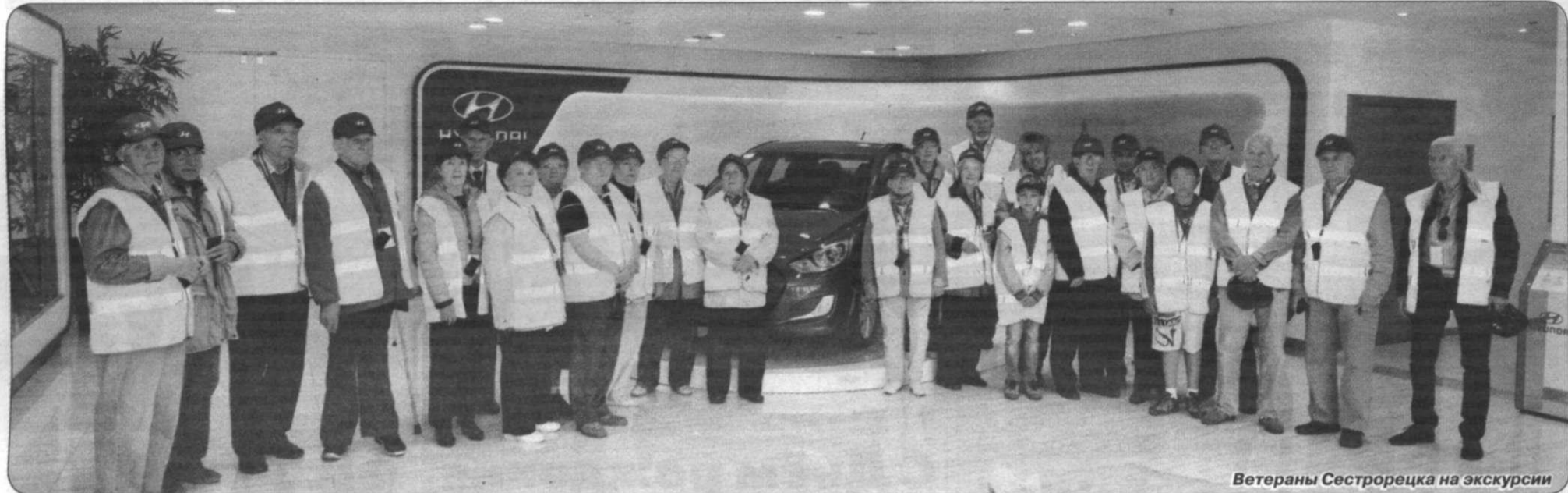
Ветераны Сестрорецка на экскурсии