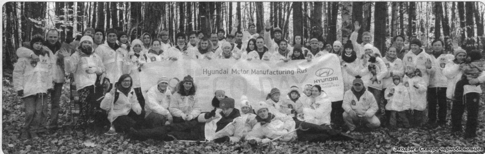
Экодэй в Сквере чернобыльцев