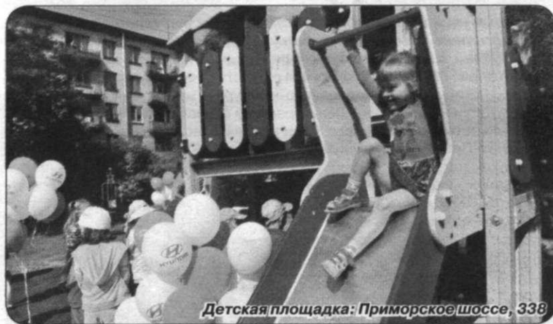
Детская площадка: Приморское шоссе, 338